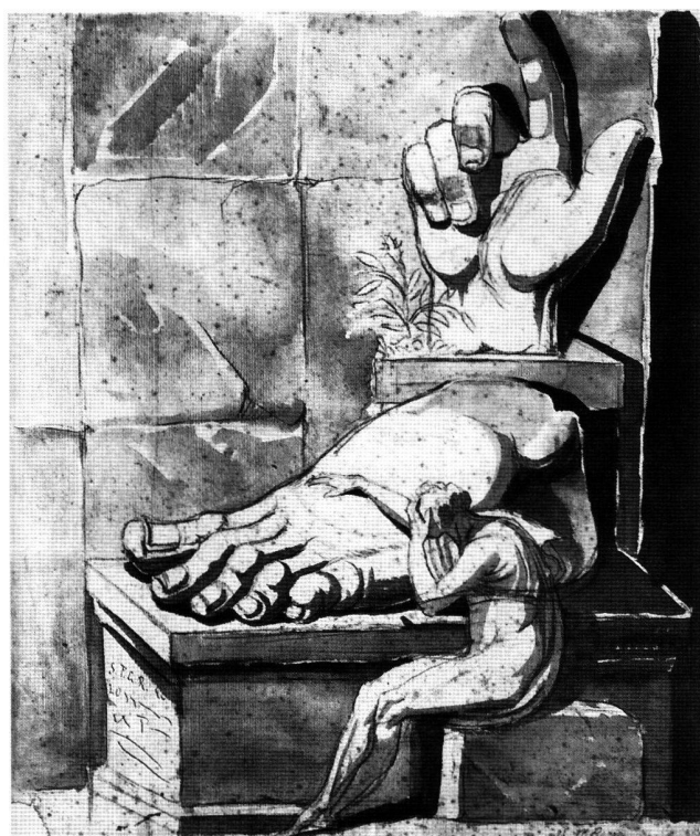
Abb. 3 Der Künstler, verzweifelnd vor der Grösse der antiken Trümmer, von Johann Heinrich Füssli, 1778–1780. Rötrel, getönt, 42 × 35,2 cm. Zürich, Kunsthaus.

Es ist bezeichnend, dass Füssli seiner Antikensehnsucht unter Berufung auf die Skulptur Ausdruck verleiht: «Der Künstler verzweifelnd vor der Grösse der antiken Trümmer» (Abb. 3). In antikischer Nacktheit sinnt er trauernd über den Untergang griechisch-römischer Kunst nach,