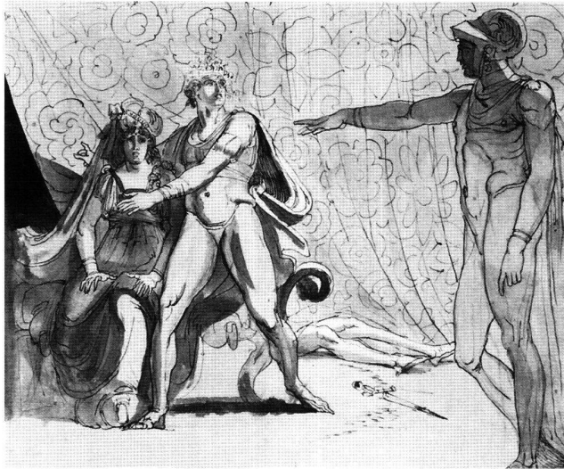
Abb. 2 Hamlet, die Königin, der Geist, der erstochene Polonius, von Johann Heinrich Füssli, 1780–1782. Feder laviert, 34 × 40 cm. Zürich, Kunsthhaus.

Während die Hände des Geistes im Gemälde übereinandergelegt sind (in der Zeichnung streckt er seine Rechte gegen Hamlet aus) und daher nicht «sprechen», nimmt die Linke Hamlets mit den ausgestreckten Fingern in ihrer räumlichen Isolierung eine in der Gesamtrechnung bedeutende Stellung ein. Sie ist in der Zone, wo grelles Licht und tiefer Schatten aufeinanderstossen, gleichsam die Nabe, jedenfalls das Motiv, welches die hohe Temperatur des Schreckens bestimmt, und von dem aus die Bewegungen des überraschten Paares, in Kadenzen gelenkt, rhythmisch