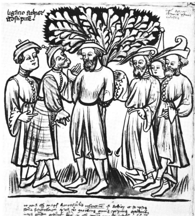
Abb. 5 Basel, Universitätsbibliothek: A II 5, fol. 182: Achior am Baum.