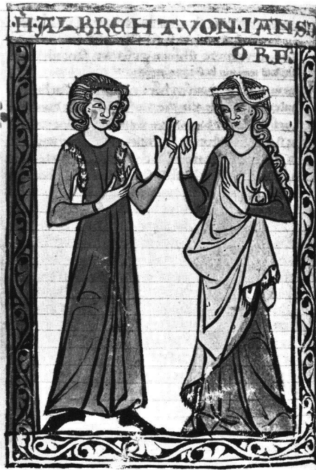
Abb. 1 Stuttgart, Württembergische Landesbibliothek: Cod. HB XIII 1, Bl. 40: Albrecht von Johansdorf .