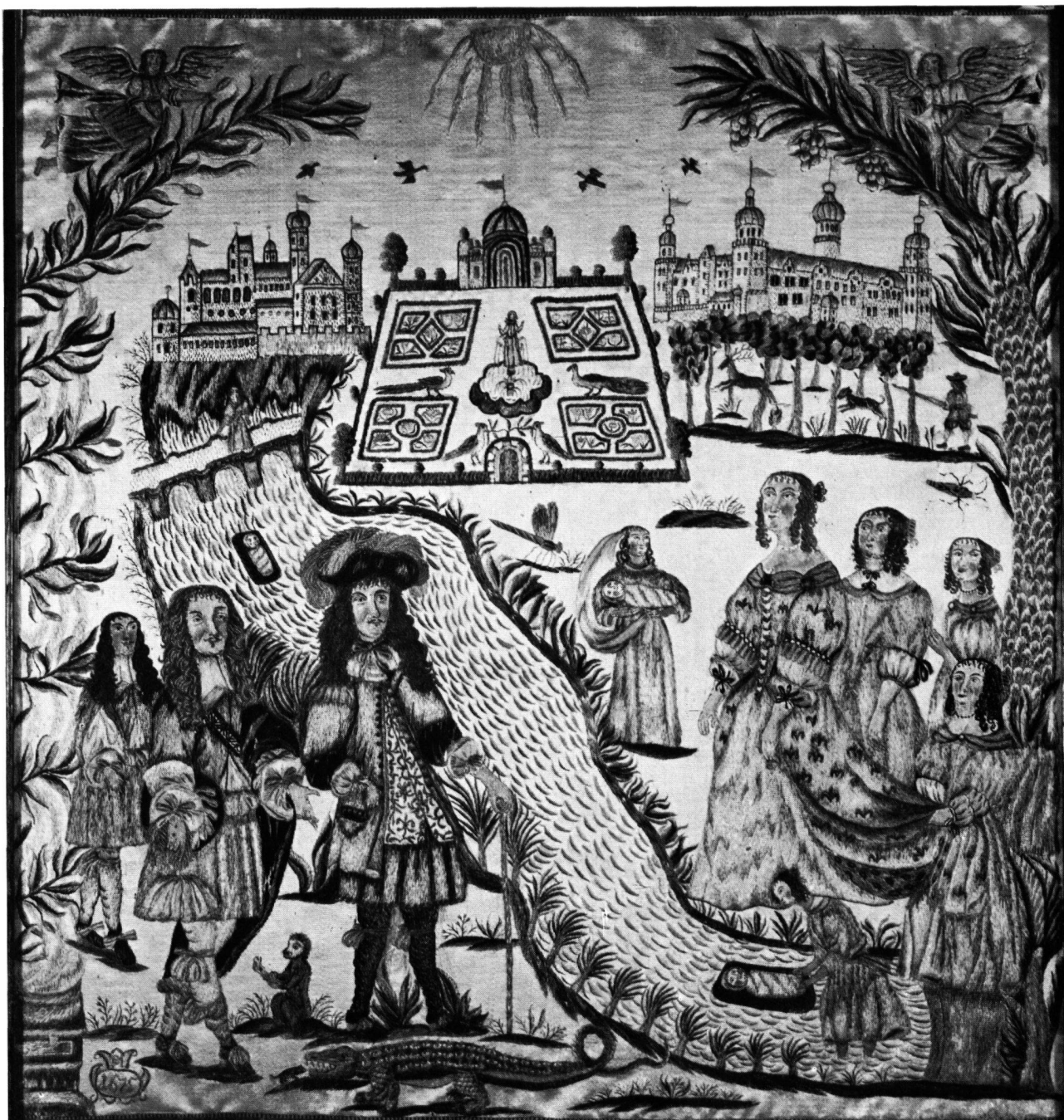
Seidenstickerei mit Darstellung der Auffindung des Moseskindes, 1675. Zürich, Schweiz. Landesmuseum.

JENNY SCHNEIDER: DIE AUFFINDUNG DES MOSESKINDES AUF ZWEI SEIDENSTICKEREIEN DES 17. JAHRHUNDERTS