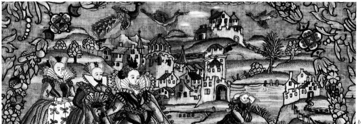
a, b Tischtuch mit Darstellung der Auffindung des Moseskinde. Seidenstickerei, 1629. Zürich, Schweiz. Landesmuseum: a Gesamtansicht, b Ausschnitt aus dem Mittelmedaillon.

JENNY SCHNEIDER: DIE AUFFINDUNG DES MOSESKINDES AUF ZWEI SEIDENSTICKEREIEN DES 17. JAHRHUNDERTS