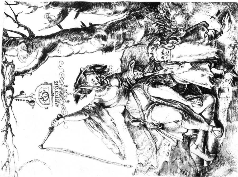
a) Federzeichnung von Urs Graf, 1521 Dessau, Anhaltische Behördenbibliothek (Nach Major-Gradmann, VRS GRAF, Abb. 70)