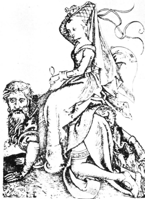
b) Kupferstich von Meister B R – Wien Albertina (Nach Diedrichs, Deutsches Leben der Vergangenheit in Bildern, Band I, Abb. 469)