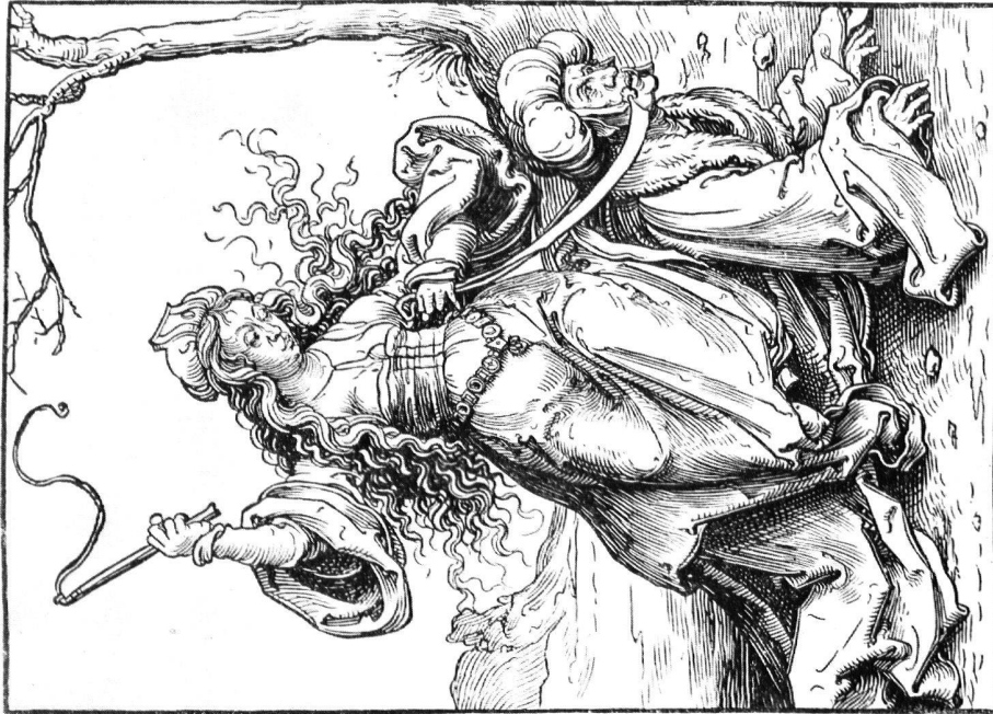
b) Holzschnitt von Lucas von Leyden (Nach Diedrichs, Deutsches Leben der Vergangenheit in Bildern, Band I, Abb. 467)