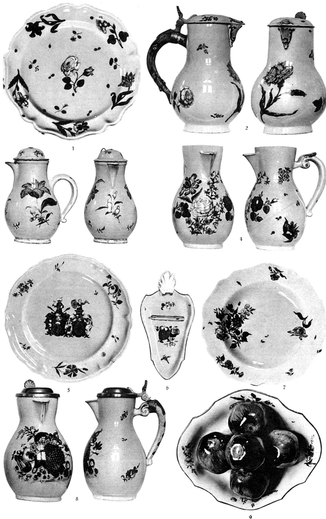
Lenzburg. Sayencen des A. H. Klug und des H. C. Klug. Schweiz. Landesmuseum.