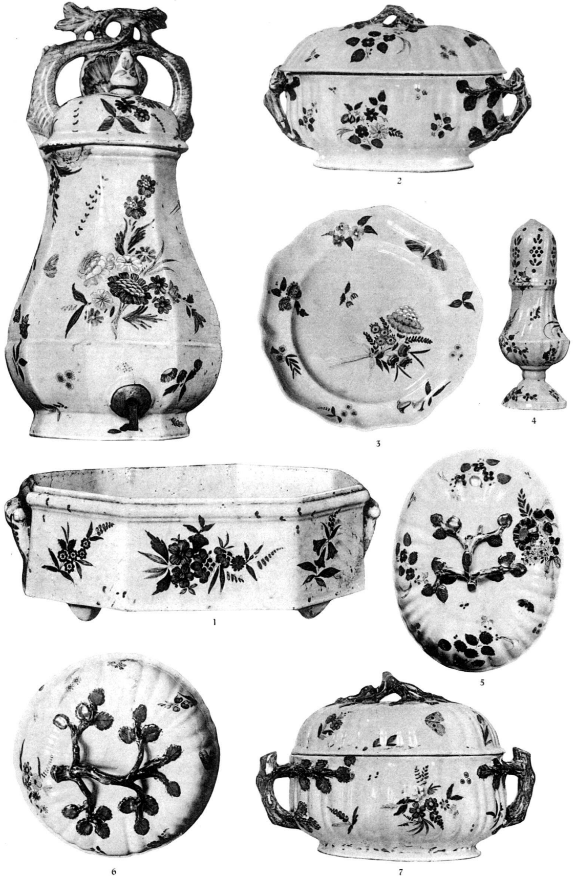
Lenzburg. Sayencen des A. H. Klug und des H. C. Klug. Schweiz. Landesmuseum.