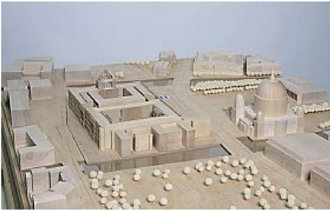
3. Preis: Eccheli e Campagnola, Verona