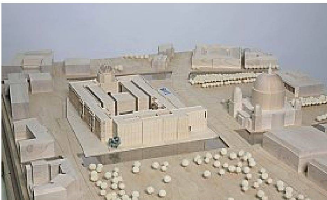
3. Preis: Kleihues + Kleihues, Berlin