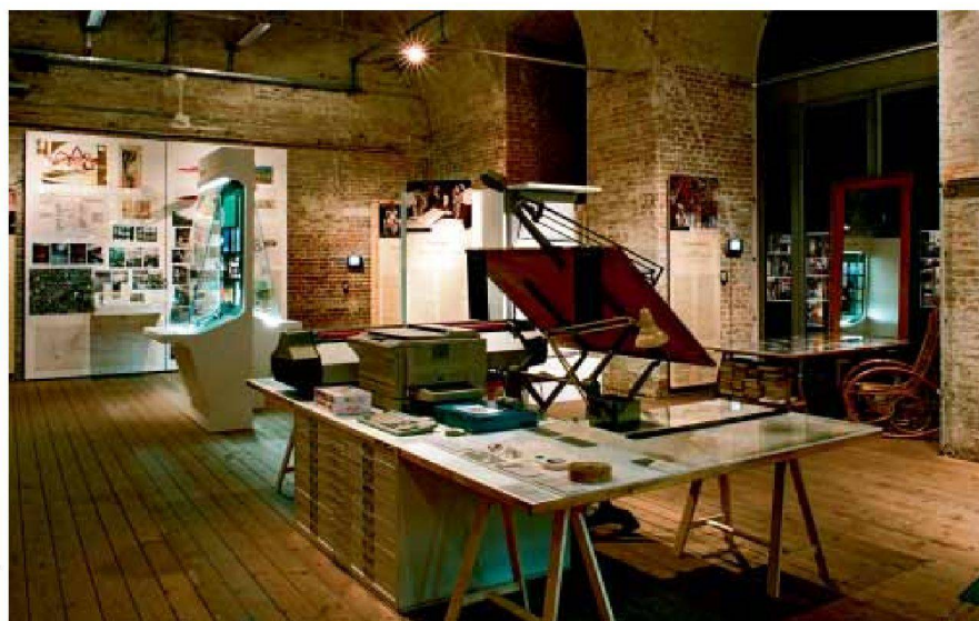
Blick in die Ausstellung im Architekturzentrum Wien

Zur Ausstellung ist ein Katalog erschienen: Elke Krasny/Architekturzentrum Wien (Hrsg.), Architektur beginnt im Kopf/The Making of Architecture, Basel Boston Berlin: Birkhäuser Verlag 2008; ISBN 978-3-7643-8979-6