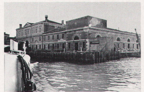
San Giobbe, Areal des früheren Schlachthofes, das aufgrund der detaillierten Richtpläne restrukturiert werden und das von Le Corbusier entworfene neue Spital aufnehmen soll.

Art. 11 des Ausführungsdekrets umschreibt die zur Ausführung von Restaurierungen und Sanierungen Berechtigten wie folgt: 1. Unternehmungen mit mehrheitlich öffentlicher Beteiligung. Es handelt sich hier um zwei, die eine befasst sich mit der Sanierung Venedigs, die andere mit der Sanierung Chioggias. Ihre juristische Form ist die Aktiengesellschaft. Die 60% nicht unterschreitende Beteiligung der öffentlichen Hand wird vom Staat, von der Region, der Gemeinde, der Provinz oder andern Lokalverbänden bereitgestellt. Wichtig ist, dass