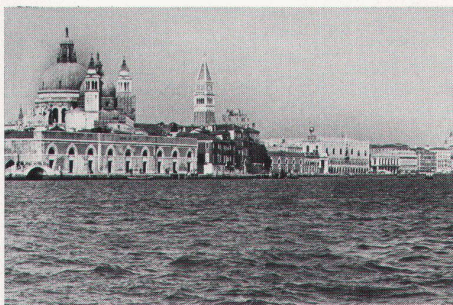
Ansicht des Gebietes Zattere ai Saloni. Der Hallenbau links war zuerst von der Gemeinde für Sporttätigkeiten bestimmt. Jetzt gehört er zu den städtischen Einrichtungen für künstlerische Veranstaltungen.

Im ganzen gesehen weisen die aufgeführten Zahlen auf eine deutliche Verflachung der Beschäftigungslage in der venezianischen Baubranche hin, wobei anzunehmen ist, dass diese Verflachung durch die Liegenschaftsspekulationen der Bauunternehmer selber noch gefördert worden ist. Ein Vergleich der Zahlen des Liegenschaftsbesitzes mit dem Ergebnis der Industriezählung von 1971 beweist, dass die Personalunion von Spekulant und Bauunternehmer Tatsache ist. Zahlreiche Bauunternehmer, die Betrieben mit über 50 Beschäftigten vorstehen,