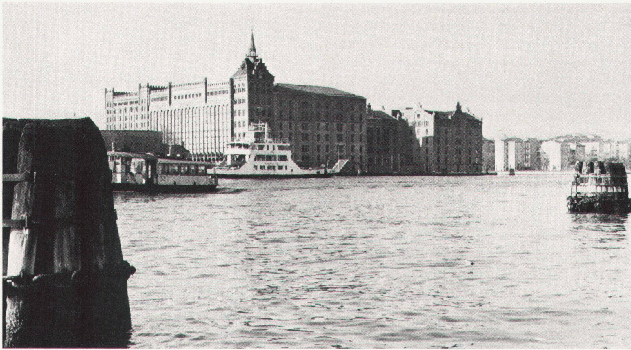
Die Mühle Stucky, welche in den detaillierten Richtplänen als Sitz öffentlicher Einrichtungen vorgesehen ist. Zur Erlangung von Vorschlägen für die Restrukturierung und Restaurierung dieses Gebäudekomplexes soll demnächst ein internationaler Wettbewerb veranstaltet werden.

b) akute Einsturzgefahr Sofortmassnahmen erheischt;