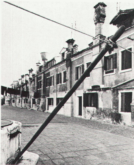
Giudecca, Corte delle Funi; Beispiel der Entwertung und des fortgeschrittenen Zerfalls von Reihenhäusern des sozialen Wohnungsbaus.

oder der Öffentlichkeit zur Verfügung stehenden Liegenschaften;