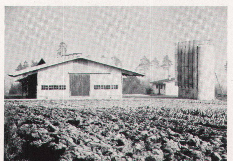
Les silos constituent une agression caractérisée contre le site. Mais ils ne sont pas la seule raison d'une mauvaise intégration: matériaux de construction trop clairs. Hangars monotones, isolement de la partie habitation y contribuent également.