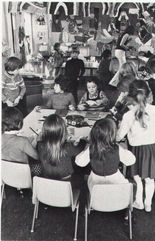
Une classe froide et nue peut devenir une pièce sympathique et confortable si l'on permet aux enfants d'arranger l'espace à leur gré et avec leurs propres moyens et si on les aide à le faire. L'influence des élèves sur leur environnement ne devrait pas s'arrêter à la porte de la classe, mais s'exercer également sur les couloirs et les salles communes de l'école. Ecole primaire londonienne dans un quartier moderne de banlieue

Aus einem kahlen Schulzimmer wird eine gemütliche Schulstube, wenn man den Kindern erlaubt und hilft, den Raum durch eigene Mittel zu gestalten. Der Einfluss der Schüler auf die Umgebung sollte bei der Türe des Klassenzimmers nicht haltmachen, sondern auch auf die Korridore und die Gemeinschaftsräume der Schule übergreifen. Londoner Primarschule in einem modernen Aussenquartier