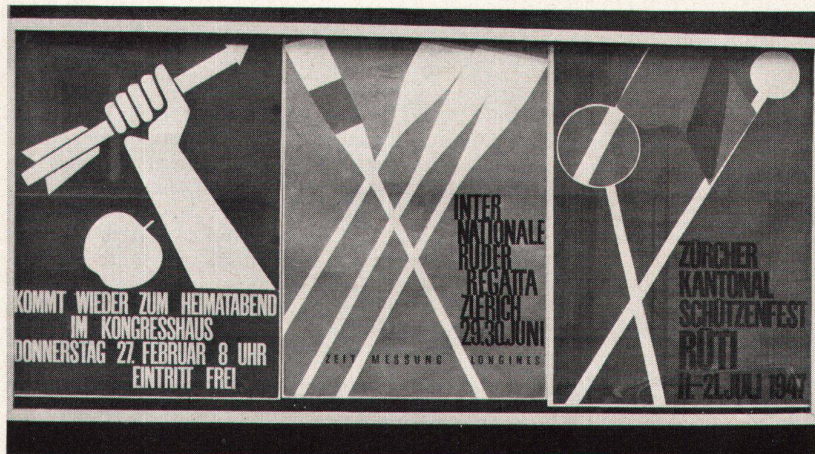
Ernst Keller, Plakate