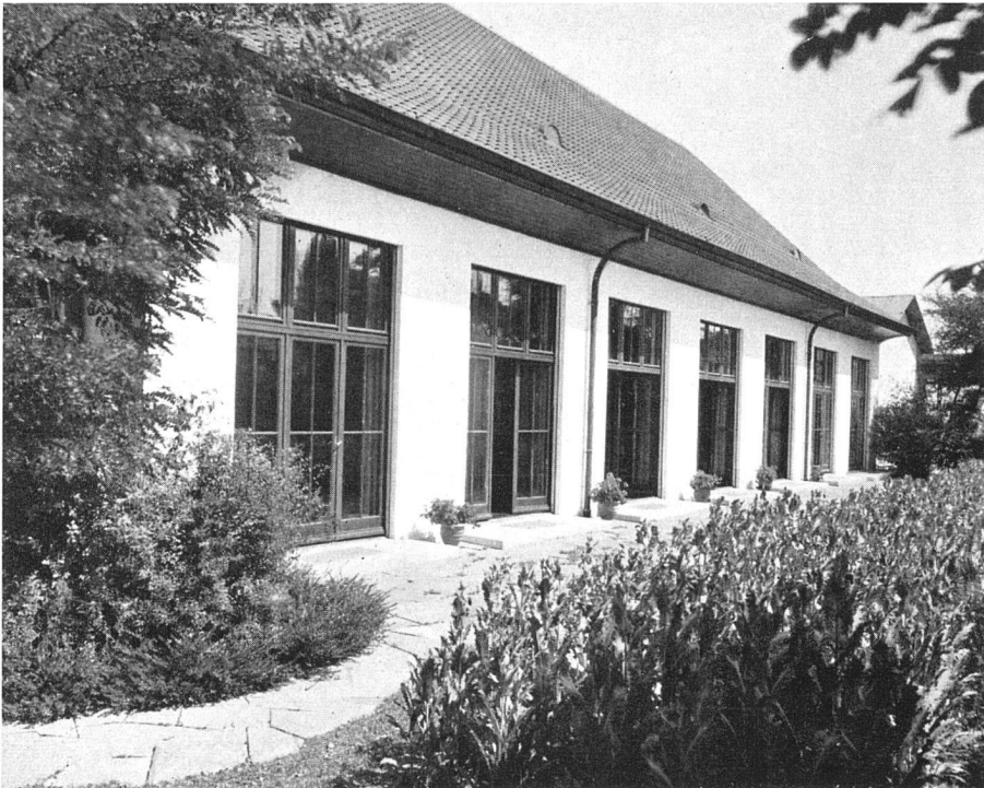
Wohlfahrtsgebäude der Waffenzabrik AG. Solothurn