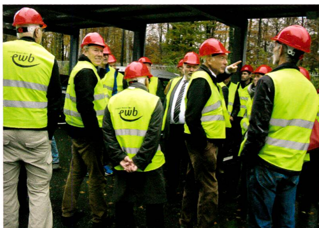
Fig. 1: Gut ausgerüstet für die Besichtigung.

Der Vorschlag zur Besichtigung dieser modernen Energiefabrik stammte wiederum von SASEG-Vorstandsmitglied Ueli Seemann, der damit das Wissen und die Expertise der Vereinigung in Debatten zu Energiefragen gemäss Artikel 2 der SASEG-Statuten vertiefen möchte. Die Besichtigung war primär für Vorstandsmitglieder gedacht; sie fand anschliessend an eine Vorstandssitzung statt. Sie wurde aber auch allen in der Schweiz wohnenden SASEG-Mitgliedern angeboten, und der Organisator konnte von seinem Netzwerk auch einige Nicht-Mitglieder interessieren.