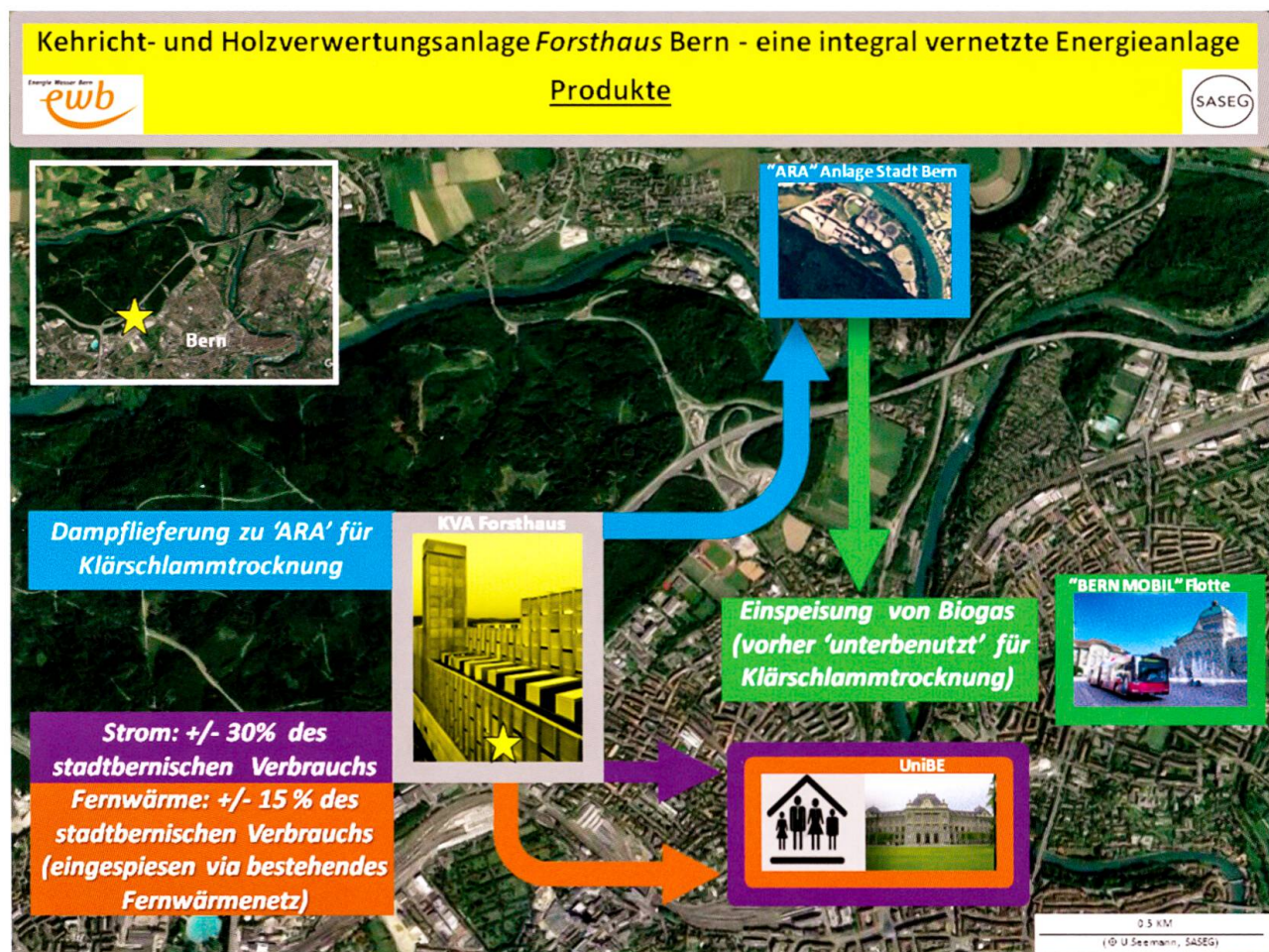
Fig. 4: Satellitenkarte von Bern mit den Flüssen von Strom, Wärme und Dampf aus der Energiezentrale Forsthaus.

Holzheizkraftwerk: Bei der Verbrennung von Holz im Holzheizkraftwerk (sowie von Erdgas im Gas-und-Dampf-Kombikraftwerk) entstehen Dampf und Fernwärme. Mit dem Dampf wird in einer zweiten Turbine ebenfalls Strom produziert, und das heisse Wasser gelangt ins Fernwärmenetz. Das hier und in der KVA benötigte Wasser wird dem