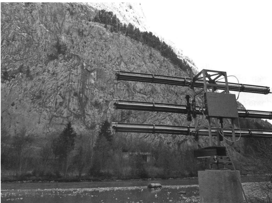
Fig. 1: Blick auf die Simmenfluh (Kanton Bern) mit dem Radargerät GPRI im Vordergrund. Unten an der Felswand ist die Nationalstrasse A6 erkennbar.

Dem Kanton Tessin (Giorgio Valenti) wird für die Unterstützung der Radarmessungen in Preonzo gedankt. Ein Dank geht auch an Andrew Kos (Terrarsense, Werdenberg) für die Erstellung des Geländemodells (Preonzo) und an Tazio Strozzi, Charles Werner und Rafael Caduff (Gamma Remote Sensing AG) für Mitarbeit an Gerät und bei der Datenakquisition.