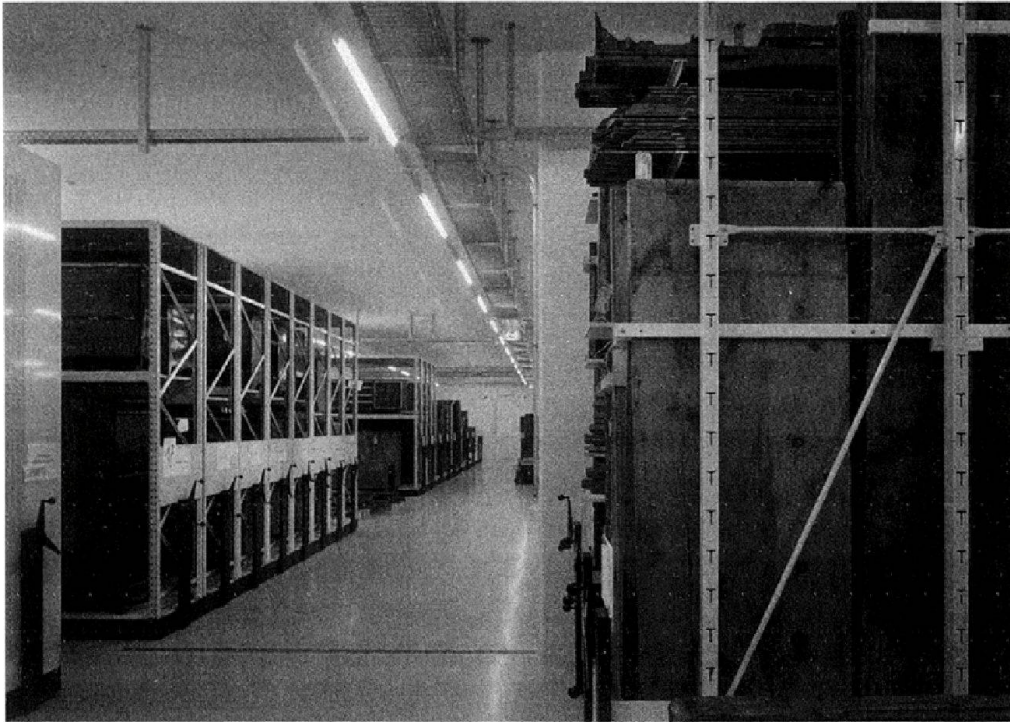
Abb. 4: Jedes Objekt wird mit einem Strichcode versehen und auf einen eindeutigen Heimatstandort eingelesen.

oder zur Vorbereitung für Ausstellungen in den Ateliers bereitgestellt werden. Durch die neue Lagerung ist das Handling der Objekte einfacher und damit sicherer geworden. Wenn ein Objekt fotografiert, konserviert oder untersucht werden muss, muss es den Gebäudekomplex nicht verlassen.