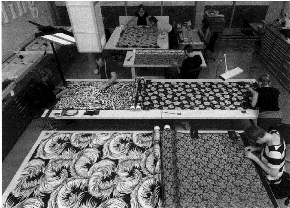
Abb. 5: Konservatoren-Restauratoren bereiten die Seidenstoffe für die Ausstellung «Soie Pirate. Textilarchiv Abraham Zürich» vor und machen sie montagefertig.

zu beschädigen. Anschliessend werden die Objekte für den Transport bereitgestellt. Die Objektlogistik erstellt Transportgebände, damit die Objekte sicher transportiert werden können. In den Ausstellungsräumen sind wiederum die Konservatoren-Restauratoren verantwortlich für die sichere und gleichzeitig möglichst unsichtbare Objektmontage. Kleider, wie der Mantel der kürzlich verstorbenen Emilie Lieberherr, werden auf Büsten montiert um sie angemessen zeigen zu können, ganz nach dem Motto presentation is everything . Im Museum kommt vor und nach der Präsentation aber immer wieder die Aufbewahrung. Damit auch künftige Generationen ihre Geschichte in Ausstellungen präsentieren können.