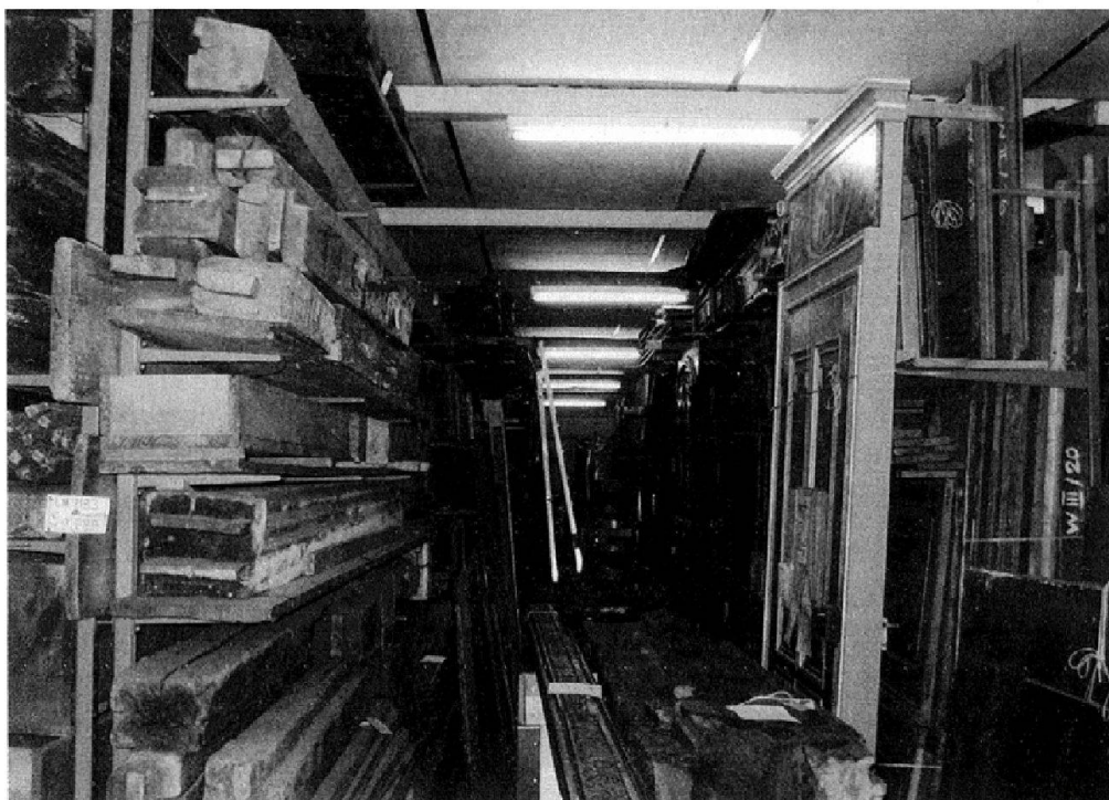
Abb. 2: In den ehemaligen Objektdepots waren die Platzverhältnisse so eng, dass der Zugang zu den Objekten nicht immer gewährleistet war.

rung der Situation notwendig. 5 Ziel war es, die Sammlungsbestände an einem Ort unter guten konservatorischen Bedingungen zu konzentrieren. Ausserdem sollten die Arbeitsplätze der Konservierung, der Konservierungsforschung, der Logistik und der Registrierung möglichst in der Nähe sein.