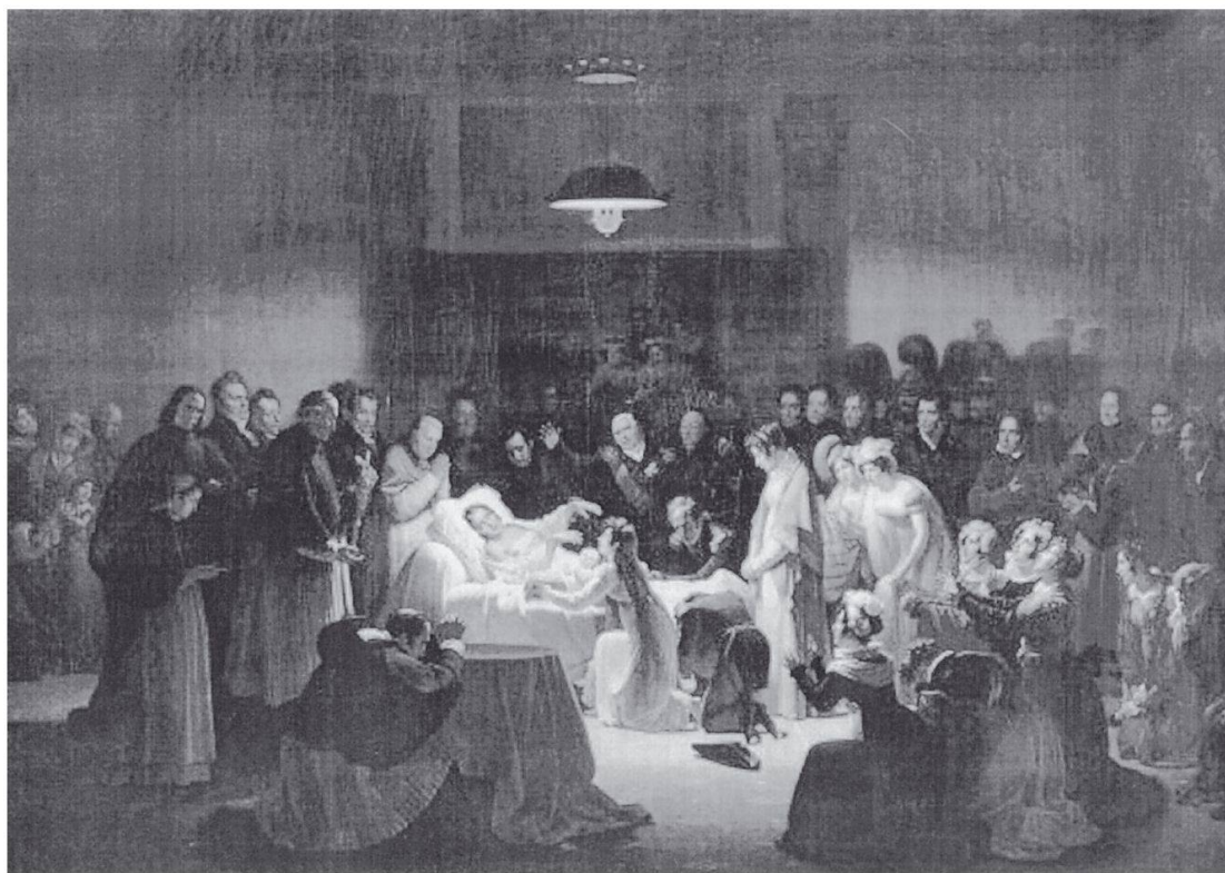
Fig. 1: «Les derniers moments du duc de Berry dans la salle de l'ancien opéra» par Alexandre Menjaud, 1824, Musée Fabre. L'héritier du trône meurt assassiné en 1820 par Louvel, un «conspirateur solitaire». L'assassinat du duc de Berry contribue au processus de réaction conservatrice qui affecte la Restauration à partir des années 1820.

de force et des luttes politiques de classement entre élites opposées – émigrés issus de la noblesse d'Ancien Régime, élites d'Empire, fractions bourgeoises en quête de position et de reconnaissance politiques – qui caractérisaient la monarchie restaurée des Bourbons, en particulier depuis l'élection en 1815 de la «Chambre introuvable» composée en majorité de royalistes convaincus, hostiles au double héritage révolutionnaire et bonapartiste. L'apparition progressive, au sein de la Chambre des députés, d'un personnel non aligné sur les positions ultra-royalistes avait permis au gouvernement, à partir de 1816, d'engager un travail de réforme soutenu par l'opposition. Cette politique de réforme, marquée par les législations «libérales» portant sur le recrutement des militaires, sur l'éligibilité et l'électorat ou encore sur la presse, avait eu pour effet de rallier les forces d'opposition à la monarchie restaurée. Mais l'ensemble des mesures de restriction des libertés publiques adoptées de justesse à la Chambre après l'assassinat en février 1820 du duc de Berry, 6 héritier du trône, avaient incité une partie de l'opposition parlementaire à se