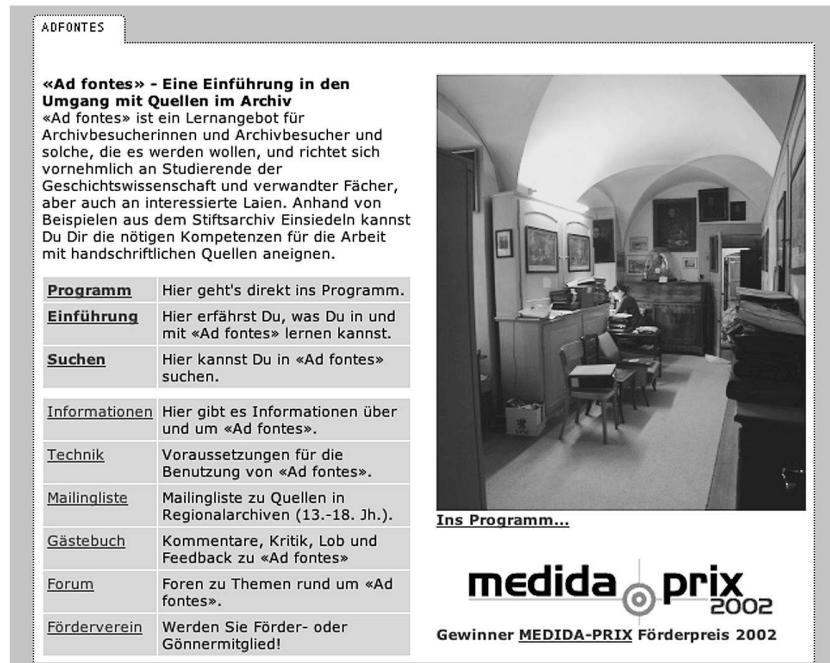
Abb. 2: Startseite von «Ad fontes».

schliessungstechniken (Regesten, Transkription, Edition, Übersetzung, Datenbank) und ein Kapitel zu den Problemen bei der Auswertung der Quellen (Quellenkritik, Quellentypologien, Schriftlichkeit, Besonderheiten einzelner Quellentypen).