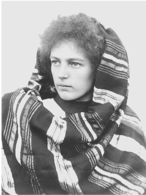
Abb. 2: Gertrud Woker, Biochemikerin.

tisch. In der Tat lässt sich aber nachweisen, dass die Experten in einem ausgesprochenen Milizsystem wie dem schweizerischen ihren Einfluss zwar weitreichend ausüben, aber wegen des Ratifikationsvorbehalts keineswegs bindende Beschlüsse für den Staat treffen konnten. Bereits 1922 hatte nämlich das Eidgenössische Volkswirtschaftsdepartement pointiert auf die weitgehenden Handlungsspielräume der Experten hingewiesen, um gleichzeitig deren Grenzen zu unterstreichen. Der Schweizer Delegation am Internationalen Landwirtschaftlichen Institut wurde mitgeteilt, dass das Departement es nicht für nötig erachte, Instruktionen zu erteilen: «Wir stellen es den Herren anheim, zu den zur Behandlung kommenden Fragen nach freiem Ermessen Stellung zu nehmen, in der Meinung, dass für allfällige Beschlüsse, die den Mitgliedstaaten neue Verpflichtungen auferlegen, die Ratifikation durch die zuständigen Behörden vorbehalten wird.» 24