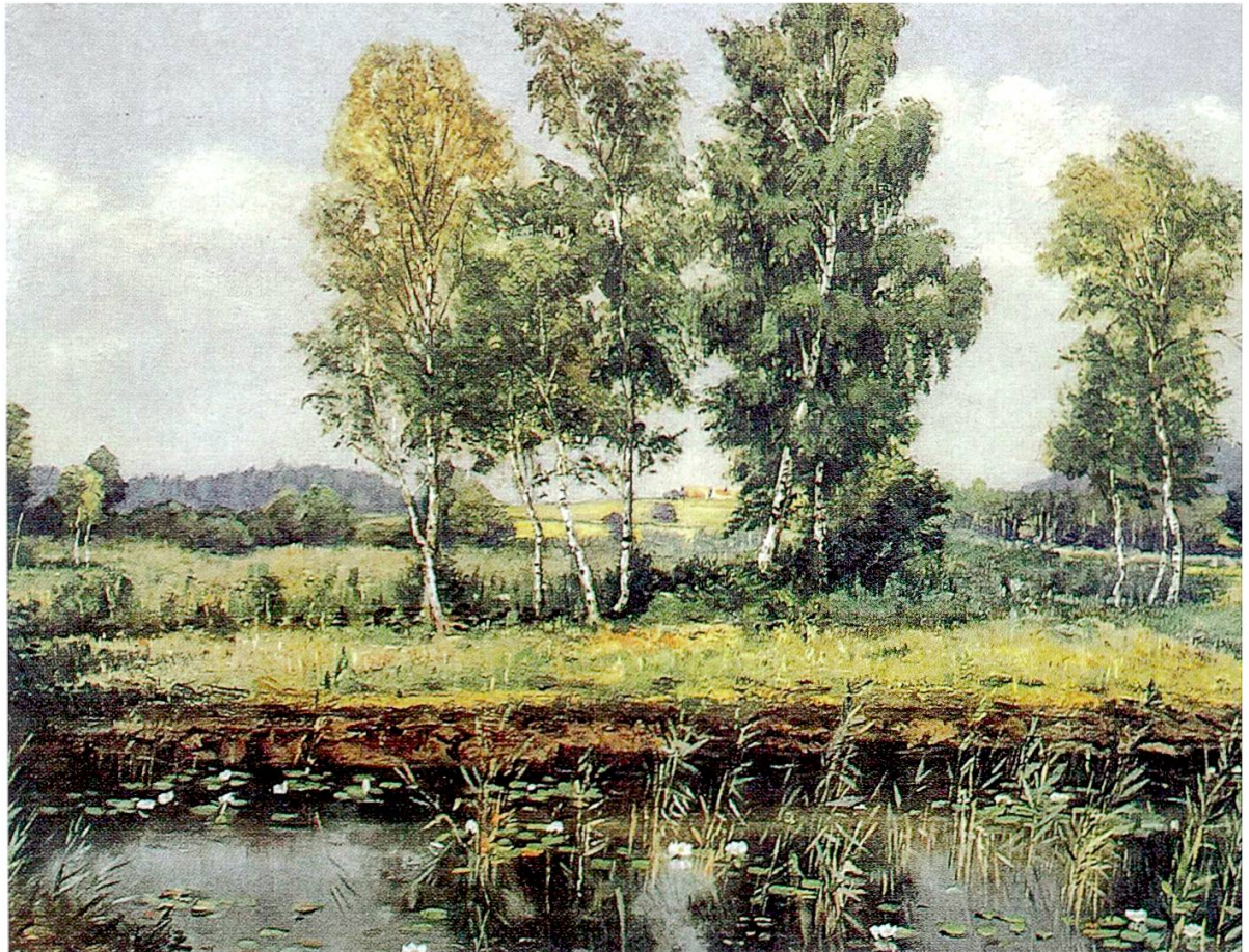
Abbildung 1: Moorlandschaft zwischen Nussbaumer- und Hüttwilersee mit Torfstich. (Gemälde von H. Herzog, vor der Melioration 1943/44)

flächlichen Austrocknen, der flächige, maschinelle Torfabbau während und kurz nach dem Ersten Weltkrieg im Bürgerriet , der kurzzeitig trostlose, braune Flächen hinterliess. Vom jüngsten Torfabbau in den Jahren des Zweiten Weltkriegs zeugen noch diverse Abbaufonten in den Wäldern am Seegraben und in den Erlen- und Birkenbruch-Wäldern am Hüttwilersee ( Neuhuserloch ). Markant und als Fischteich genutzt ist das tiefe Saurerloch , südlich des Seegrabens, das damals von der Firma Saurer in Arbon ausgehoben wurde.