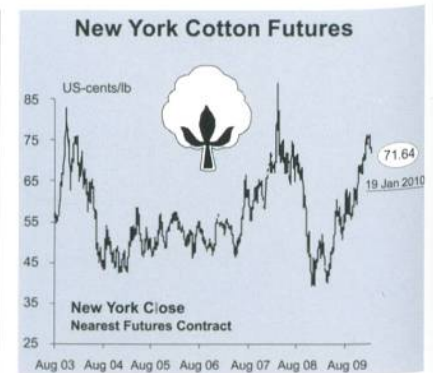
Abb. 1: Baumwollpreisentwicklung

Die Daten über die tatsächlichen Ernteflächen sind für 2009 noch nicht verfügbar. Dennoch zeigen die Schätzungen, dass ein Areal von 9'555 acres (3'867 ha) gegenüber 7'289 acres (2'950 ha) im Jahre 2008 erreicht werden könnte.