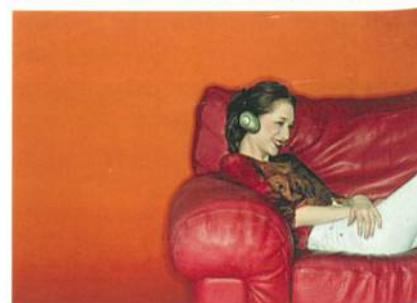
Abb. 2: Nähte an Heimtextilien haben vorrangig Halte- und Befestigungsfunktionen

Fast alle Heimtextilien haben Nahtverbindungen. Markisen, Matratzen, Steppdecken, Polstergarnituren, Gardinen, Bettwäsche – sie alle brauchen Nähte für die gewünschte Formgebung. Die Nähte an Heimtextilien haben vorrangig Halte- und Befestigungsfunktionen (Abb. 2). Markisennähte verbinden die einzelnen