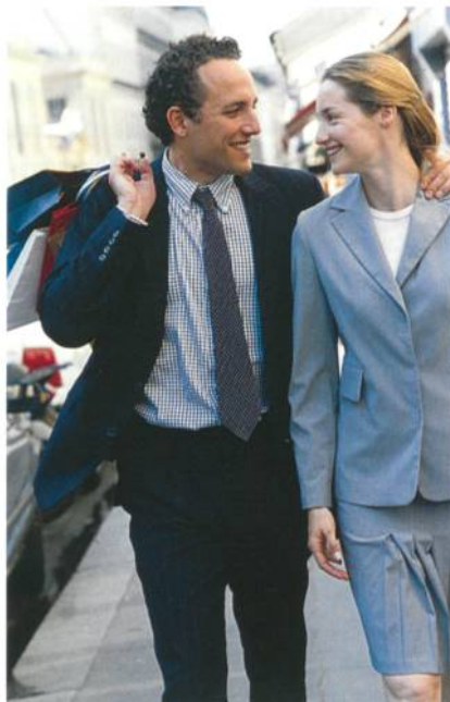
Abb. 1: Nähte sind das verbindende Element bei Bekleidung

Wenige Errungenschaften beeinflussen das Wohlbefinden so unmittelbar wie die Kleider, die wir auf unserer Haut tragen. Mit keiner