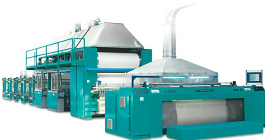
Abb. 3: Die Schlichtvorrichtung SMR

Weitere Vorteile bietet «INDIGO-PILOT». Das Zusatzaggregat garantiert mit integrierter ONLINE Titration sowie Auswert- und Berechnungssoftware genaue Ansatzrezepturen und konstante Farbflottenkonzentrationen hinsichtlich der eingesetzten Zutaten INDIGO, Alkali und Reduktionsmittel. Durch eine kundenorientierte, abgestimmte Prozessüberwachung, Regelung der Fadenspannung, Steuerung der Quetschkraft und Farbaufnahme entsteht ein Produkt,