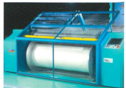
Abb. 1: Die BEN DIRECT

Die BEN DIRECT (Abb. 1) dient der Zettelbaumerstellung mit Baumdurchmessern von bis zu 1'400 mm und nutzt hierfür eine elektro-hydraulische und selbstzentrierende verzahnte Steilkegel-Baumaufnahme. Eine exakt geführte Presswalzenvorrichtung inklusive Kick-Back-Automatik sorgt für eine einwandfreie zylindrische Zettelbaumbewicklung.