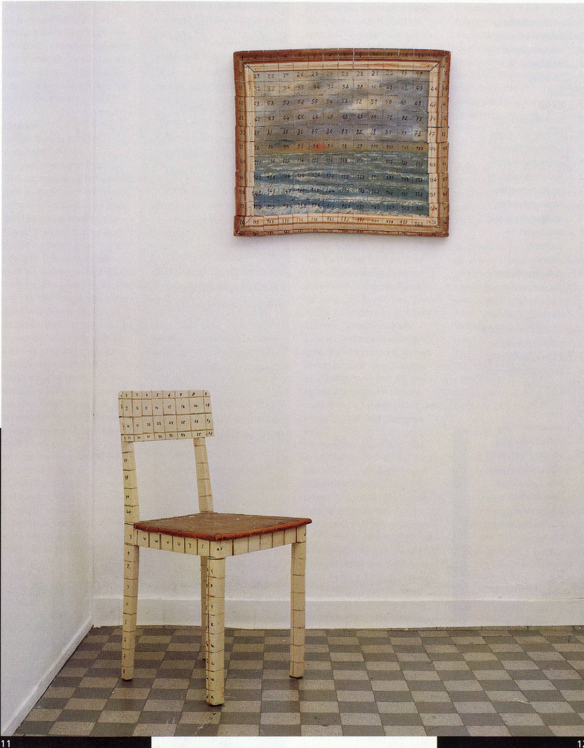
11 Sans titre, 1989, chaise découpée, colle, marker, 81 x 39 x 38 cm.