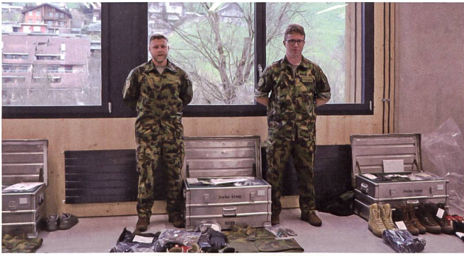
Der SCHWEIZER SOLDAT war bei der Materialfassung des SWISSCOY Kontingent 48 im Februar 2023 dabei.