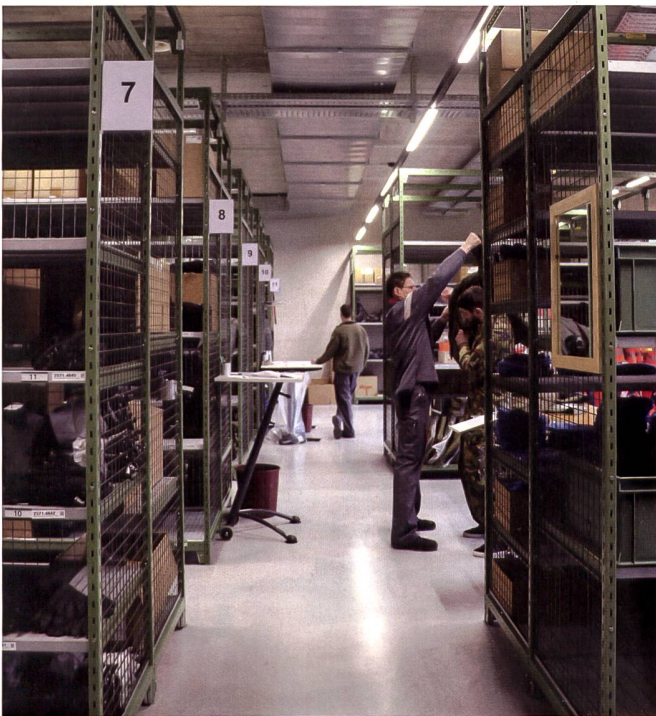
Moderner und übersichtlicher. Im Vergleich zum alten Zeughaus kann in der neuen Retablierungsstelle wesentlich komfortabler und effizienter gearbeitet werden.