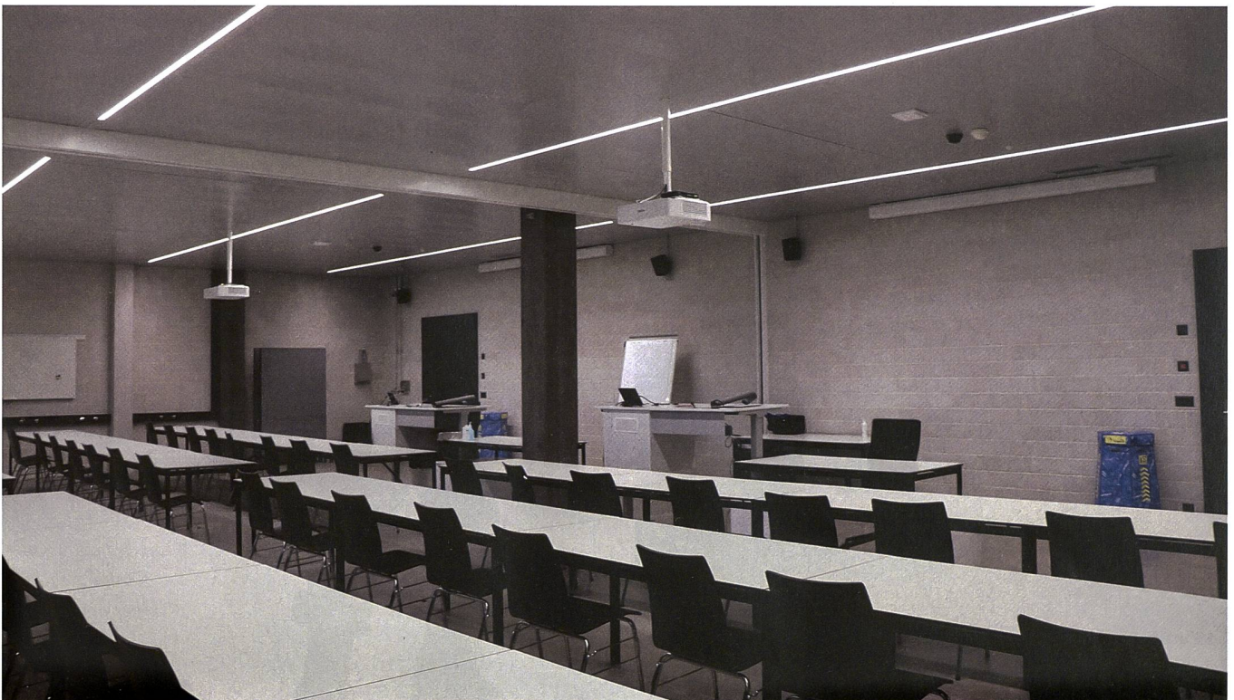
Neue Ausbildungsräume. Nun ist genug Platz da, um die Ausbildung innerhalb des Waffenplatzes durchzuführen.

Was bald nicht mehr abgegeben wird, sind die sogenannten «Beingümmeli». Denn der Kampfstiefel KS 90 gehört be-