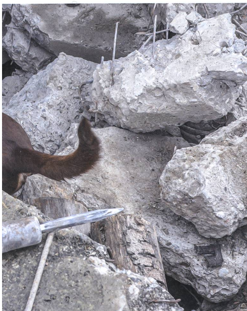
ner Technologie bleibt die Nase des Hundes erschollenen Personen geht.