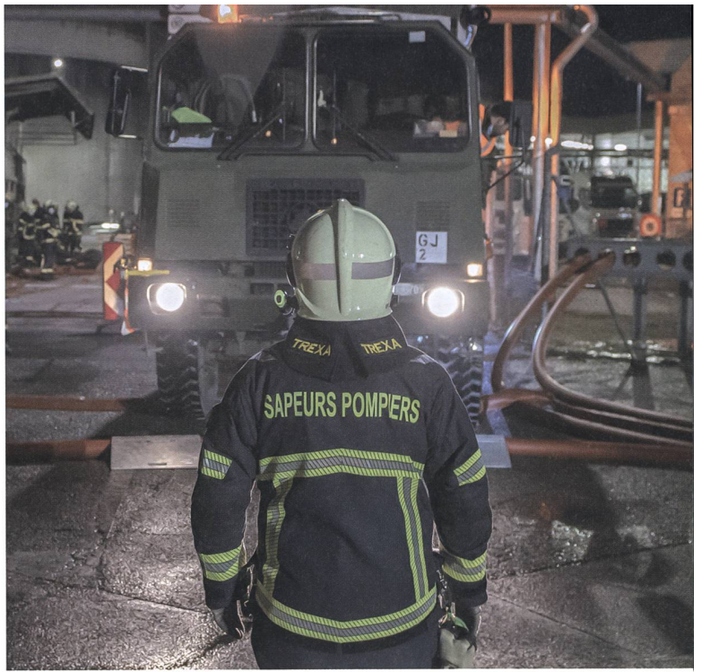
Zusammenarbeit mit der freiwilligen Feuerwehr Vernier: Die Armee lieferte das Löschwasser in die Nähe eines fiktiven Grossbrandes.