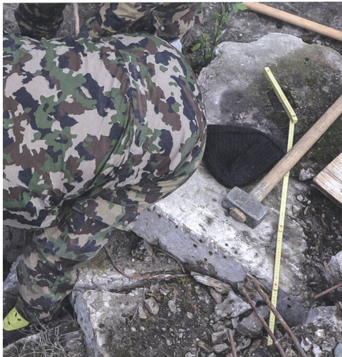
ungssoldat sein will, muss sich auch zu den