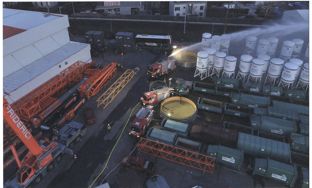
Vogelperspektive: Die zivilen und militärischen Systeme arbeiten zusammen. Die Löschbecken wurden von der Armee aufgestellt und befüllt. Die Feuerwehr Morges nutzt ihre Tanklöschfahrzeuge, um den Brand zu löschen.