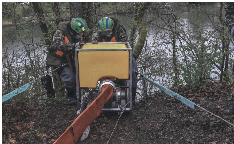
Ebenfalls zu den Fähigkeiten des Rttg Bat 2 gehört der Wassertransport. Dabei wird mit einer Tauchpumpe (im Bild) Wasser von einer Quelle bezogen und dann zu der benötigten Stelle gepumpt.