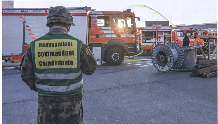
Ein gutes Gefühl nach den Übungen. Auch in Zukunft bleibt das Rttg Bat 2 bereit.