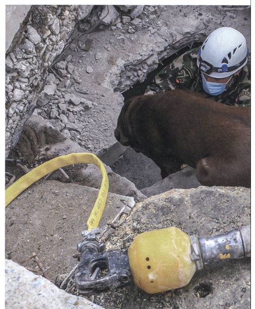
Unterstützung vom Rettungshund: Trotz mode einfach unschlagbar, wenn es um die Ortung vo