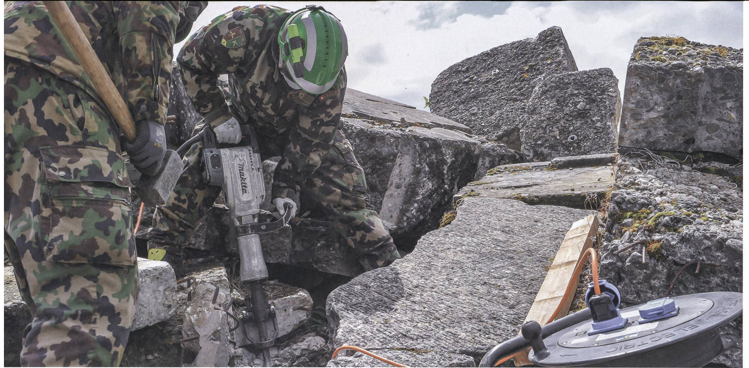
Das Rettungsbataillon kann verschüttete Menschen aus einer Trümmerlage befreien.