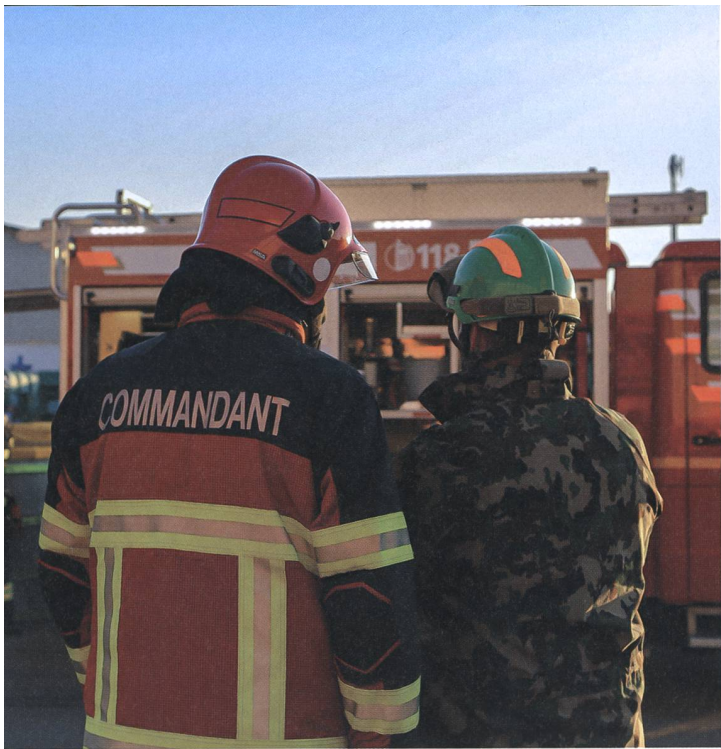
Starker Partner: Im WK wird die zivil-militärische Zusammenarbeit regelmässig trainiert.