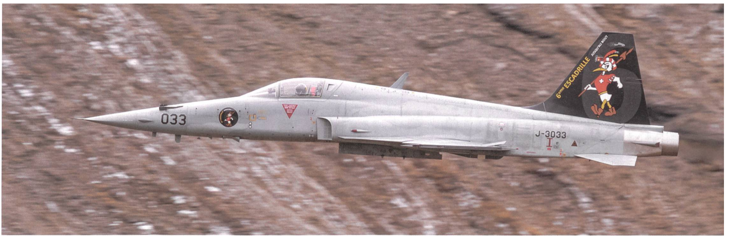
Der F-5 Tiger J-3033 der 6. Escadrille, der 6. Staffel, mit dem wehrhaften Schweizer Donald Duck auf dem Leitwerk.