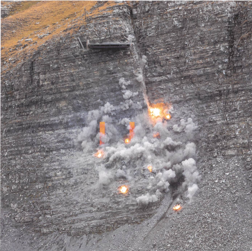
Jahr für Jahr bildet das Fliegerschiessen einen Höhepunkt der traditionsreichen Luftwaffen-Vorführung auf der Axalp. Trefferbild im Fels wie aus dem Lehrbuch.