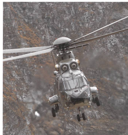
Axalp: Der Display-Cougar T-340.

Monat für Monat erfreuen uns Spitzenfotografen wie Franz Knuchel, Mattias Nutt und Marius Schenker zusammen mit Profis aus der Truppe mit attraktiven Bildern. Marius Schenker gibt jetzt zwei attraktive Kalender für 2019 heraus: einen über Grenadiere, der andere über Fallschirmaufklärer. Wir stellen Schenker vor und bringen zusätzlich rechts seine ganz spezielle Bildausbeute vom Axalp-Fliegerschiessen 2018.