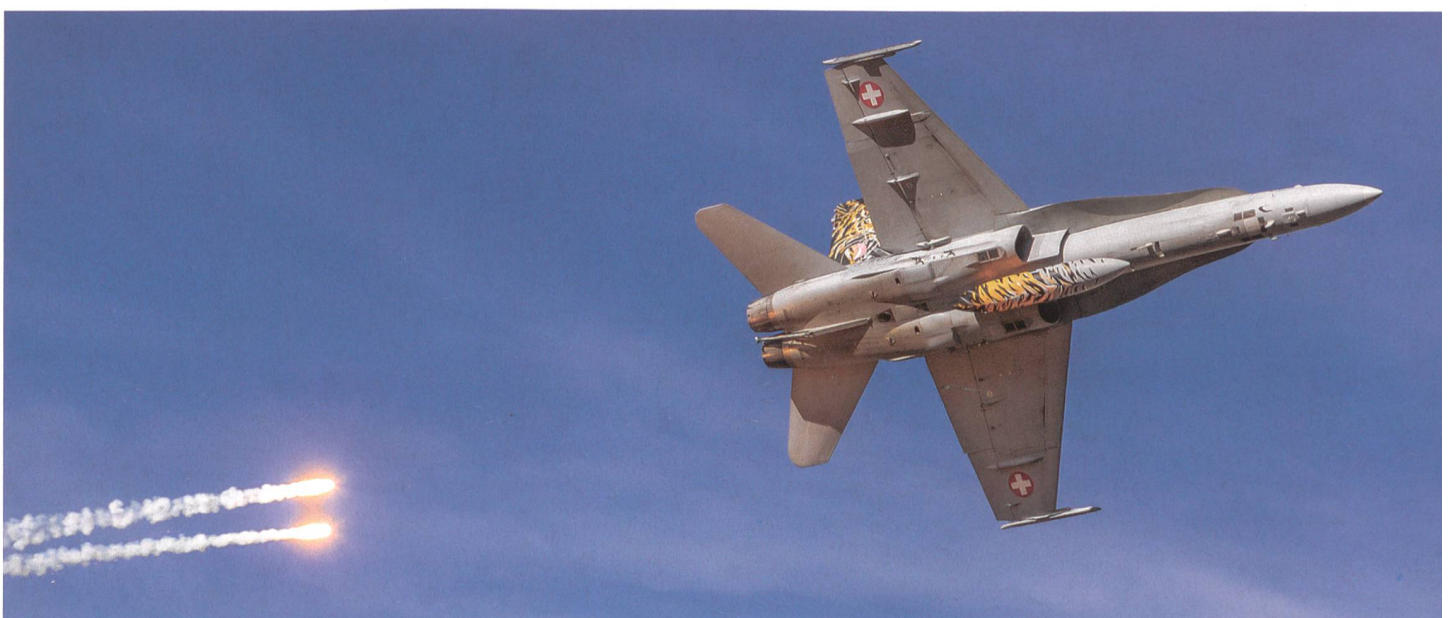
Die Staffelmaschine J-5007 der Fliegerstaffel 11 stösst über der Axalp zum Eigenschutz zwei Flares (Täuschkörper) aus.