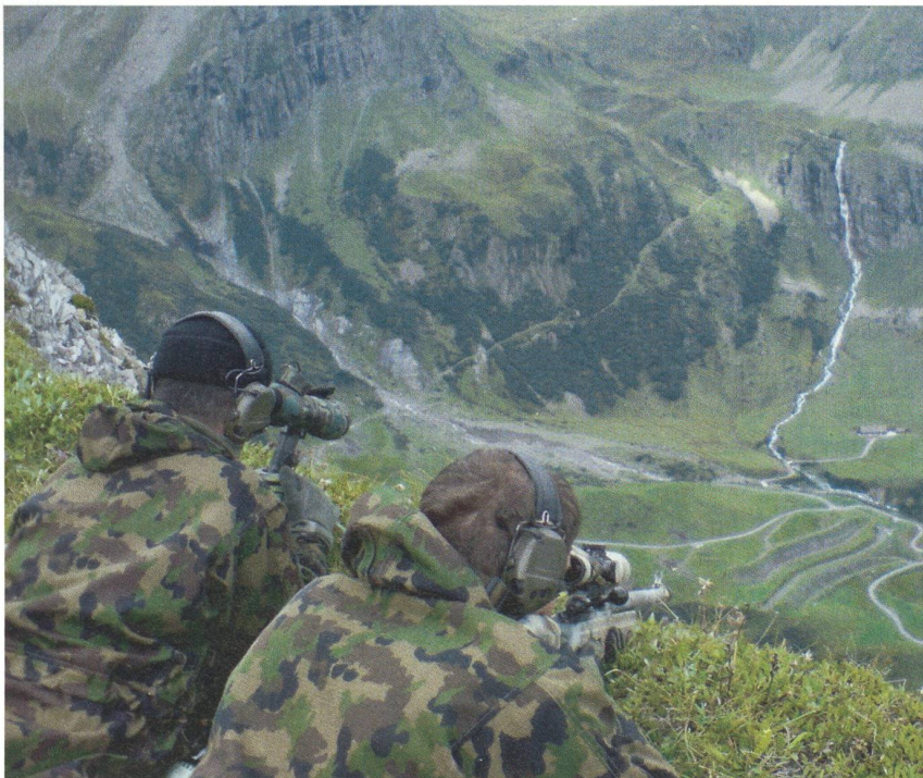
Das Armee-Aufklärungsdetachment 10 stellt hohe Anforderungen an die Kämpfer.

Auf seinem Winterspaziergang äusserte Bundesrat Ueli Maurer die Idee, das Armee-Aufklärungsdetachment 10 solle nicht mehr im Ausland, sondern in der Schweiz selber eingesetzt werden.