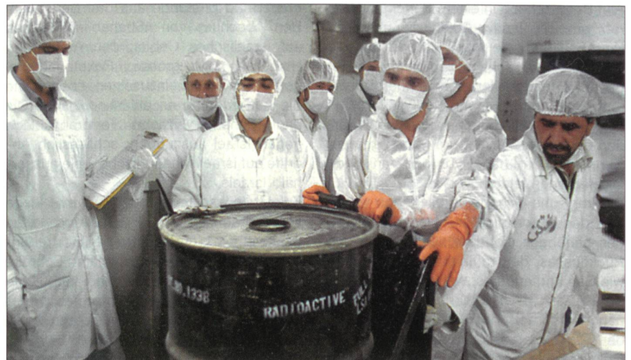
In Isfahan wandeln Wissenschaftler Uran in das Gas Uranhexafluorid um – eine Vorstufe der gefährlichen Urananreicherung.

Mit diesen Waffen können mehr als zwei Meter verstärkter Beton durchschlagen werden. Aus Israel vernimmt man, dass Abhöranlagen eingerichtet seien und der israelische Beobachtungssatellit Ofek 6 über Iran positioniert worden sei. Zur Abwehr möglicher Gegenschläge mit Raketen besitzt Israel das hochmoderne Raketenabfangsystem Arrows-II, das in