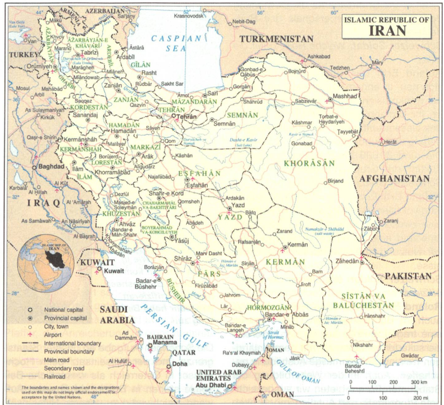
Im Mittelpunkt des Interesses: Iran.

Staatsgründung 1948 (Erklärung in der Knesset am 21. Juli 2004). Der amtierende Ministerpräsident Ehud Olmert stellte ferner am 10. Januar dieses Jahres fest, Israel könne es Iran nicht erlauben, Nuklearwaffen zu entwickeln.