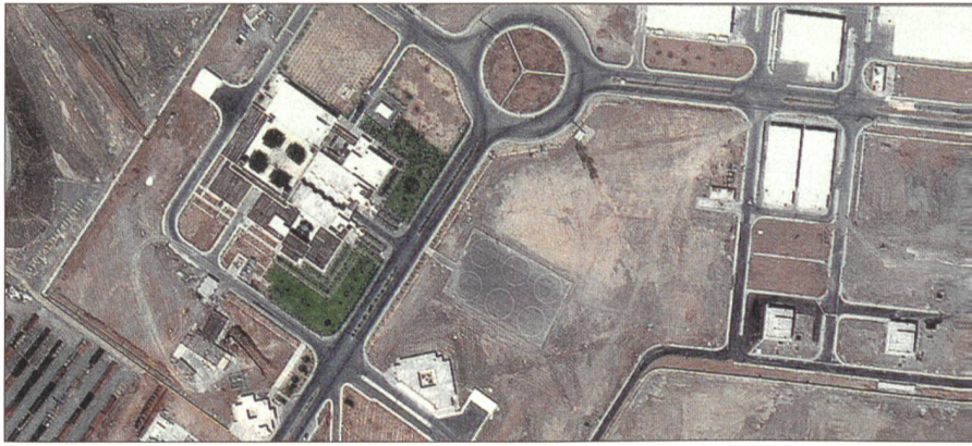
Satellitenbilder zeigen die Forschungsanlage im irakischen Natans. Laut Nachrichtendiensten arbeiten Wissenschaftler hier bereits an der Anreicherung von Uran.

Das Kraftwerk im südiranischen Bushehr soll im Jahr 2006 fertig werden. Das Projekt war bereits in den 70er-Jahren gestartet worden, verzögerte sich aber wegen der Islamischen Revolution 1979 und des Iran-Irak-Kriegs in den 80er-Jahren. 1995 vereinbarte der Iran die Vollendung des Kraftwerks mit russischer Unterstützung. Teheran will mit Hilfe des Kraftwerks den Öl- und Gasverbrauch des Landes senken und mehr Rohstoffe exportieren. In den nächsten 20 Jahren will der Iran 20 weitere, kleinere Atomkraftwerke bauen.