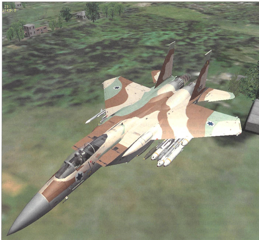
Israelische Kampfmaschine IS F-15I (Computersimulation).

Die iranische Ölindustrie allerdings würde z. B. den Export nicht nur wegen des Geldes benötigen, sondern auch wegen des Rückflusses der raffinierten Ölprodukte, wie Gas und anderes, weil sie nicht genug Kapazitäten bei Raffinerien hätten. Auch hänge die iranische Wirtschaft völlig von den Ölexporten ab. Wenn tatsächlich ein Ölembargo ausgesprochen würde, wäre Iran weit mehr davon betroffen als der Rest der Welt.