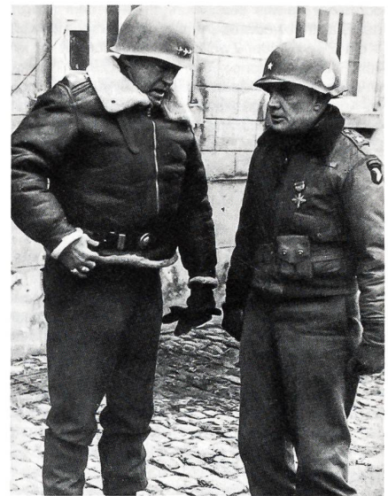
General Georges Patton mit dem Kdt der amerikanischen 101. Luftlandedivision, General Anthony McAuliffe.

Amerikaner, Belgier und hohe alliierte Militärs haben am 16. 12. 1994 mit einer Zeremonie in der belgischen