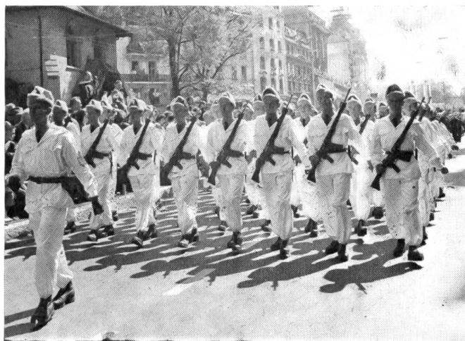
Die Skisoldaten waren durch dieses Detachement am Tag der Armee an der EXPO in Lausanne gut vertreten. Neu ist dabei die Wintermütze der Armee; warm und kleidsam einem finnischen Modell nachgebildet.

Es ist unter anderem gerade auf diese Entwicklung zurückzuführen, daß man auch den individuellen Skiwettkampf wieder in das nationale Programm der Winter-Armeemeisterschaften aufgenommen hat, wie das aus dem Programm für 1965 hervorgeht.