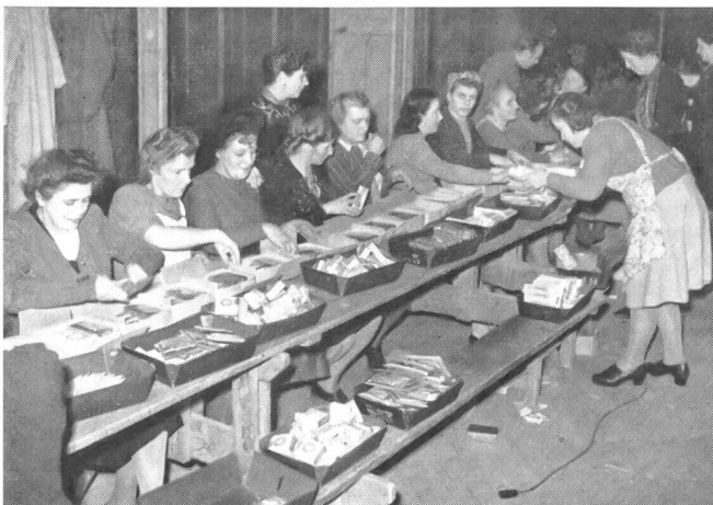
Vorbereitung für die Soldatenweihnacht.

Besser bekannt ist es wohl, daß im ganzen Lande Frauen jeden Alters und Standes Hunderttausende von Soldatenhemden genäht und noch viel mehr Socken gestrickt haben, um sie alle durch die Soldatenfürsorge den Wehrmännern zukommen zu lassen. Wer Gelegenheit dazu hatte, die Berge von Geschenkpaketen zu sehen, welche die Frauen auf Weihnachten vorbereiteten und in die entlegensten Häuser und Hütten bedürftiger Soldatenfamilien schickten, der wird auch das nicht vergessen. Und die Zehntausende von offiziellen «Soldatenpäckli», die Ende November tagelang am laufenden Band von freiwilligen Helferinnen gepackt wurden, damit jeder im Dienst stehende Wehrmann das Seine am Weihnachtstag