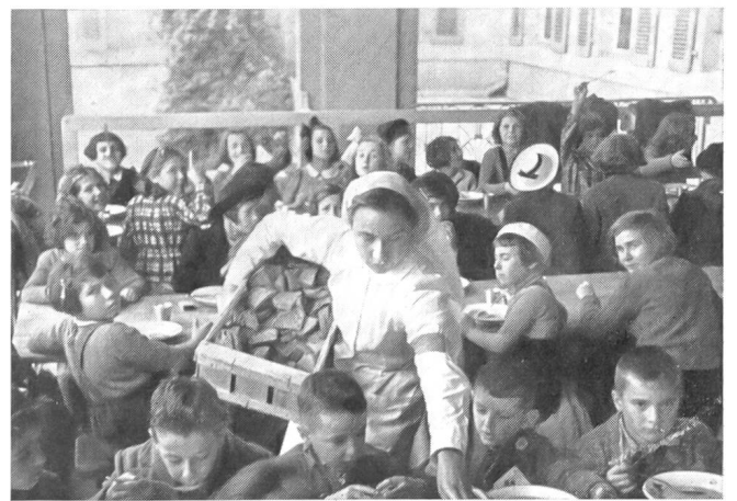
Brotverteilung an Flüchtlingskinder.