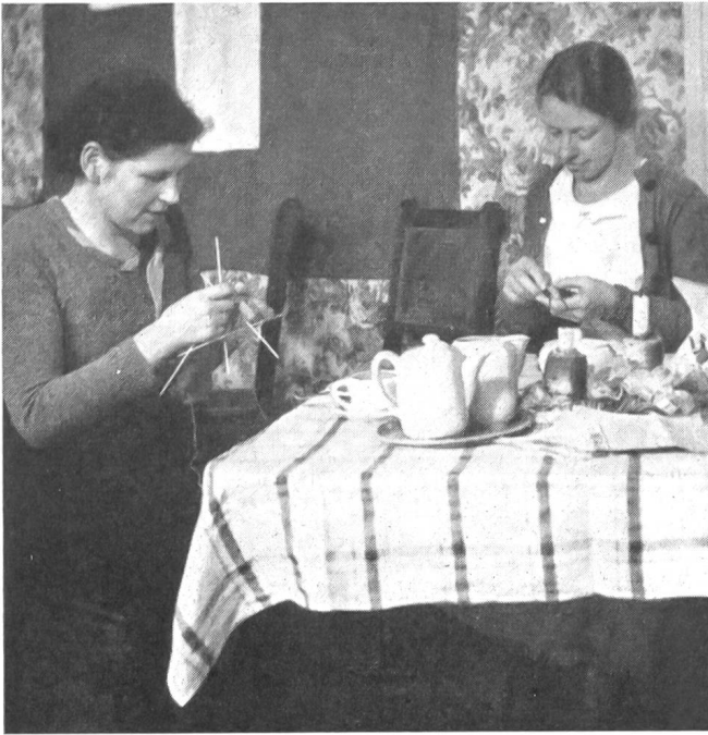
Hier werden Socken für die Soldaten gestrickt.

erhalte! In ihnen drückten die Frauen den Dank der Heimat an die Armee aus! Nie hätten sie es über sich gebracht, nur die von der Zentralstelle für Soldatenfürsorge in Bern zur Verfügung gestellten Fabrikartikel in das Päckli hineinzulegen. Einen persönlichen und liebevollen Charakter sollte es haben! So spendeten die Helferinnen Koffern und Körbe voller Beigaben und zusätzlicher Geschenke und keines der Päckli ging hinaus, ohne ein menschlich teilnehmendes Wort, einen persönlich hergestellten Gegenstand, eine Schülerzeichnung oder — trotz Rationierung! — zu Hause hergestellte Süßigkeiten. Bei all dem war das schönste Erlebnis die Unermüdlichkeit des Helferwillens. In einem schlichten Soldatenbrief stand: «Uns Soldaten ist es eine große Genugtuung, daß unsere Opfer an Zeit und Verdienst im fünften Kriegswinter noch genau so gewürdigt werden wie am Anfang der Grenzbesetzung.»