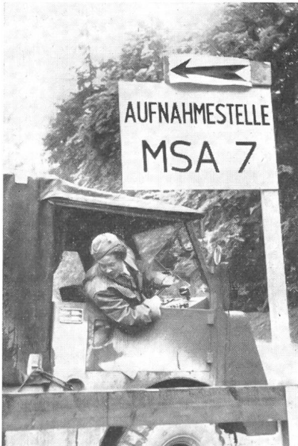
◀ Sanitätsmotorfahrerin fährt mit einem Transport von «Schwerverwundeten» in die Aufnahme­stelle der MSA. (Aus den Manöver­übungen des Armeesani­tätsdienstes 1954.)