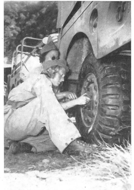
Eine Panne, für Motorfahr­erinnen kein Problem! ▶ ATP