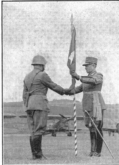
No. de censure N/F 1311

groupes d'aviation et la garde du drapeau viennent recevoir chacun leur drapeau de la main du commandant en chef de l'armée. Le général serre la main à chaque commandant, et chaque commandant lui promet de rester digne de l'étendard qu'il reçoit. A leur tour, ils le tendent à l'adjudant sous-officier porte-drapeau puis vont se placer à l'autre bout du carré. Lorsque les sept drapeaux sont devant le public, le général, le chef d'Etat-major général, le chef d'arme de l'aviation et les officiers de l'état-major du général se mettent au garde-à-vous et saluent les drapeaux claquant fièrement au vent, pendant que la fanfare joue le cantique suisse et qu'une escadrille de cinq avions vient saluer à sa ma-