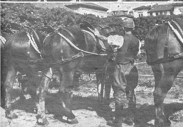
Mobilmachung La mobilisation