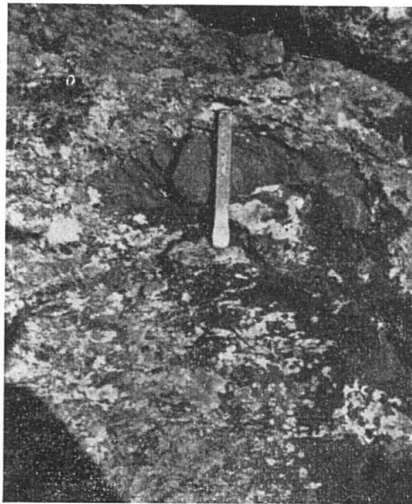
Fig. 1. Enclave calcaire dans la diabase du point 2001 (Flix). Le ciseau donne l'échelle

c) On remarque de nombreuses inclusions de toutes tailles et de toutes formes généralement intercalées entre les sphéroïdes. H. P. CORNELIUS s'est posé la question de l'origine de ces enclaves (1, p. 281), qui ne sont du reste pas toutes calcaires ainsi qu'il le croit (fig. 1).