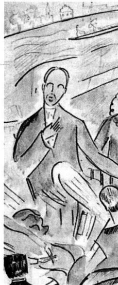
Alice Bailly: Un après-midi dans le jardin de la «Fluh» sous le charme des idées de Rilke (Ausschnitt), Insel Verlag, Frankfurt am Main.

«Die Fahnen stammeln», «Dem Fürsten zum Zeichen»: Diese Sätze, die im Original gar nicht bzw. nur in einer konventionellen Metapher stehen, drücken das semiotische wie auch metaphysische Prinzip aus, das Rilke offensichtlich «im Russischen» für