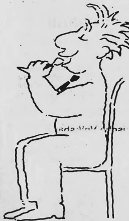
Das Kleininserat. Der ideale Platz, um für seine Spezialitäten Feinschmecker zu finden. Kleine Inserate. Grosse Wirkung. Publicitas.