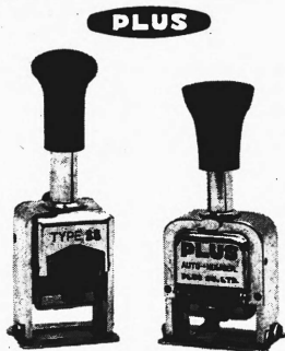
Mod. A-0001/56tg. 12345 Mod. A-0010/56tg. 123456

Numerieren Sie Ihre Belege - z. B. Rechnungskopien, Zahlungsbelege, Quittungen, Listen usw. nach einem klaren System, indem Sie die erste Dezimale für das Jahr, die zweite für das Kalenderquartal und die dritte bis sechste die fortlaufende Nummer programmieren. Durchschnittsbetrag pro Rechnung: Summe durch letzte Belegnummer. Einfacher und billiger geht es nicht. Findige Köpfe werden weitere, raffiniertere Anwendungsmöglichkeiten entdecken.