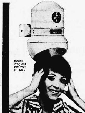
Modell Progress 1200 Watt Fr. 340.-

Baege-Händetrockner gehören in jeden fortschrittlichen Betrieb: Cafés, Restaurants, Hotels, Büros, Fabriken, Spitäler, Sanatorien, Warenhäuser, Kinos, Theater, Tankstellen usw. Baege-Haartrockner, beliebt und bewährt in Sportstätten, Bädern, Schwimmhallen, Douchen-Anlagen usw.