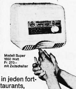
Modell Super 1650 Watt Fr. 270.- mit Zeitschalter

Baege-Trockner trocknen angenehm, schnell und gründlich (von zwei Seiten intensiver Warmluftstrom). Einfache Bedienung: Ein Knopfdruck genügt, 40 Sekunden lang zirkuliert sympathisch temperierte Luft. Fertig. Kein Ärger mehr mit zerrissenen, schmutzigen Handtüchern. Weitere Vorteile sprechen für Baege-Trockner: praktisch unbeschränkte Lebensdauer (Spezialmotor mit Dauerschmierung auf Kugellagern). Thermoerschutz (kein Überhitzen möglich). Robustes Stahlgehäuse. Geringe Betriebskosten. Kleiner Preis. Baege-Trockner sind SEV-geprüft, geräuscharm und platzsparend.