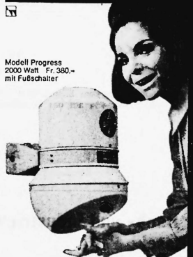
Modell Progress 2000 Watt Fr. 380.- mit Fußschalter

Baege-Trockner trocknen angenehm, schnell und gründlich (von zwei Seiten intensiver Warmluftstrom). Einfache Bedienung: Ein Knopfdruck genügt, 40 Sekunden lang zirkuliert sympathisch temperierte Luft. Fertig. Kein Ärger mehr mit zerrissenen, schmutzigen Handtüchern. Weitere Vorteile sprechen für Baege-Trockner: praktisch unbeschränkte Lebensdauer (Spezialmotor mit Dauerschmierung auf Kugellagern). Thermoerschutz (kein Überhitzen möglich). Robustes Stahlgehäuse. Geringe Betriebskosten. Kleiner Preis. Baege-Trockner sind SEV-geprüft, geräuscharm und platzsparend.