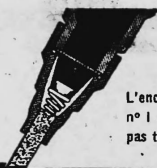
L'encre Jax n° 1 n'est pas toxique

3 km d'écriture. Jax No 1 contient 3 fois plus d'encre liquide que les flacons remplis surtout d'ouate saturée d'encre.