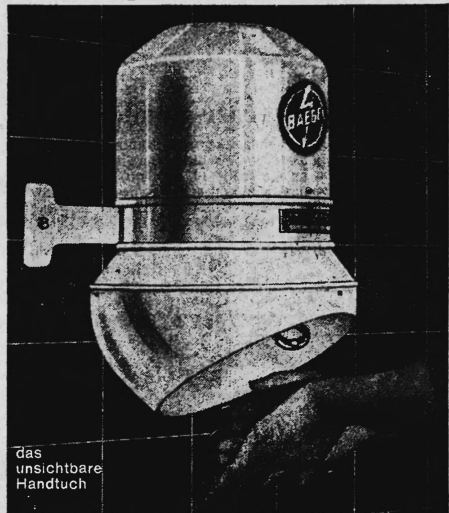
das unsichtbare Handtuch

Mit dem Baege-Händetrockner nie mehr schmutzige und zerrissene Handtücher.