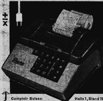
Comptoir Suisse: Halle 7, Stand 751

Cette nouvelle PRECISA électrique ne coûte que Fr. 850.-