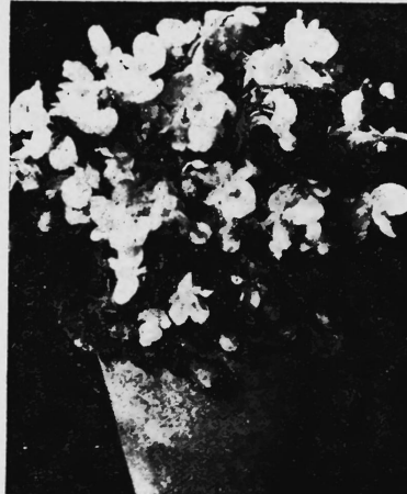
BEGONIA SEMPERFL. GRAC. KARIN

Nr. 155250. Hinterlegungsdatum: 18. Januar 1955, 6 Uhr. Samen-Mausier AG., Weinplatz 10, Zürich 1 (Schweiz). Produktions- und Handelsmarke.