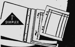
Schreibbücherfabrik SIMPLEX AG Bern

Beweglicher mit Losblättern! Vertikaler für Buchhaltungs-, Sammlungs- und Dokumentationszwecke. Protokolle, Salair-, Personal-, Lager- und Wertschriften-Kontrollen usw. sind SIMPLEX-Losblätternbücher mit ihrem auswechselbaren Inhalt. Auskünfte über die verschiedenen Ausführungen und Lineaturen (u. a. Journale bis 12 Konti) durch jede Papeterie.