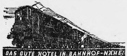
DAS GUTE HOTEL IN BAHNHOF-NAHE