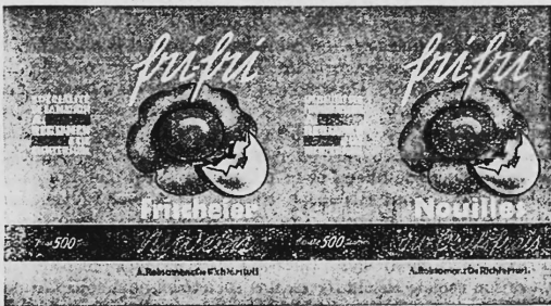
(Die Marke wird blau, gelb, weiss und schwarz ausgeführt).

Teigwaren mit frischen Eiern hergestellt.