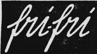
(Die Marke wird weiss auf blauem Grund ausgeführt).

Nr. 73359. — Hinterlegungsdatum: 18. August 1930, 19 Uhr. A. Rebsamen & Cie., Fabrikation, Richterswil (Schweiz).