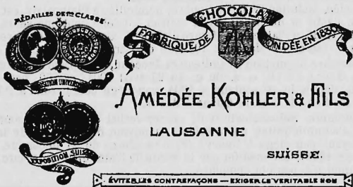
ÉVITEZ LES CONTREFAÇONS — EXIGER LE VÉRITABLE NOM

(Transmission du n° 10207 de la Société anonyme de la fabrique de chocolat Amédée Kohler & fils, à Echandens.)