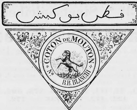
Gebleichtes, einfaches Baumwollgarn.

Nr. 9509. — 9. September 1897, 8 Uhr a. Emil Hinerwadel, Fabrikant, Lenzburg (Schweiz).