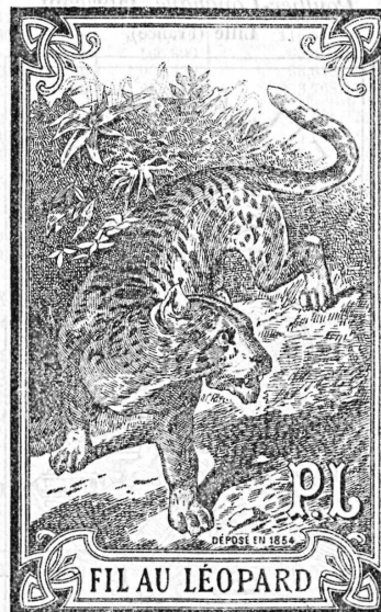
Fils de lin, de coton ou autres.

Poullier-Longhayé, fabricant, Lille (France).