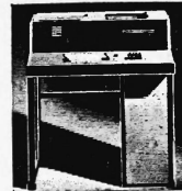
Preiskategorien von Fr. 2450.- bis ca. Fr. 150 000.-

Datenerfassungsgeräte in Off-line-Techniken mit Lochkarten, Lochstreifen und optisch lesbaren Schriften. On-line-Terminals für Simplex- und Duplex-Verkehr mit EDV-Anlagen beliebiger Provenienz.