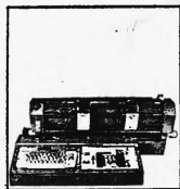
Preiskategorien von Fr. 6100.- bis ca. Fr. 98 000.-

Buchungsautomaten verschiedener Baureihen elektromechanischer und elektronischer Konstruktion mit 2-4 Grundoperationen, 2 - 256 Rechenwerken bzw. Speichern, Volltext oder Kurztext, von der einfachen Vorsteckeinrichtung über den photoelektrischen Kontoeinzug bis zur automatischen Saldolesung mit Magnetkonten, Anschluss von Karten- und Streifenlochern.