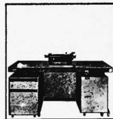
Preiskategorien von Fr. 20 500.- bis ca. Fr. 45 000.-

Fakturier- und Abrechnungsautomaten in 2 Grundmodellen vollelektronischer Konstruktion. 3-4 Grundoperationen, 3-32 Datenspeicher, Anschlussgeräte zur maschinellen Daten-Ein- und -Ausgabe.