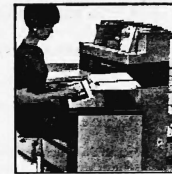
Preiskategorien von Fr. 72 200.- bis ca. Fr. 500 000.-

Leistungsfähige Computer der dritten Generation für die mittlere Datentechnik. Kernspeicherkapazität von 4 - 16 K. Programm- sowie Daten-Ein- und -Ausgabe mit Kassettenmagnetband, alphanumerischer Blockdrucker mit einer Geschwindigkeit von 50-60 Zeichen pro Sekunde. Mit und ohne Magnetkonto-Verarbeitung: Speicherkapazität pro Kontoseite 400 alphanumerische Stellen (800 je Kontoblatt). Volle Integration des Datenflusses durch Peripherie-Geräte.