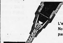
L'encre Jax No 1 n'est pas toxique

3 km d'écriture. Jax No 1 contient 3 fois plus d'encre liquide que les flacons remplis surtout d'ouate saturée d'encre.