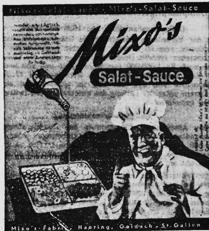
(Die Marke wird in den Farben rot, grün, blau und gelb ausgeführt.)

Nr. 99755. Hinterlegungsdatum: 10. April 1941, 18 Uhr. Haering, St. Gallerstrasse, Goldach (St. Gallen, Schweiz). Fabrik- und Handelsmarke. Salatsauce.