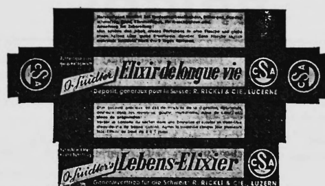
(Die Marke wird blau, gelb und weiss ausgeführt.)

Nr. 99762. Hinterlegungsdatum: 8. Mai 1941, 20 Uhr. Central-Apotheke & -Droguerie Rickli & Co. Luzern, Bahnhofstrasse 21, Luzern (Schweiz). — Fabrik- und Handelsmarke. Pharmazeutische Produkte.